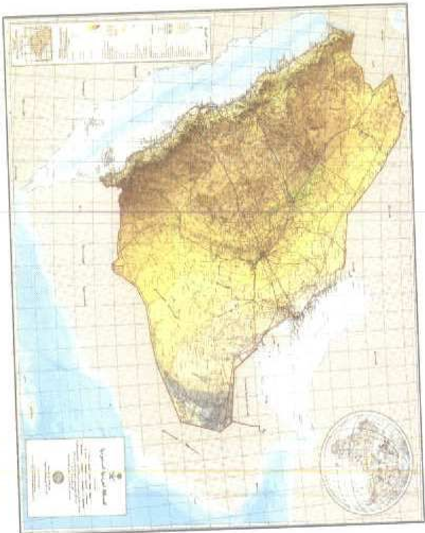
خريطة المملكة العربية السعودية صدرت هذه الخريطة من الهيئة العامة للمساحة بالمملكة العربية السعودية الطبعة الثالثة ١٤٣٠ هـ - ٢٠٠٩ م رقم الإيداع بمكتبة الملك فهد الوطنية ٣٨٣٦ / ١٤٣٠ هـ ردمك : ٨٠١٥ - ٦٠٣ - ٩٧٨