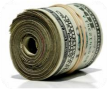
RIBA (DOBÂNDA) ȘI REGULILE SALE