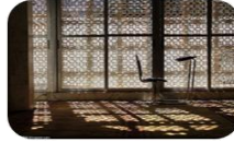
Capitolul 2: Rugăciunea