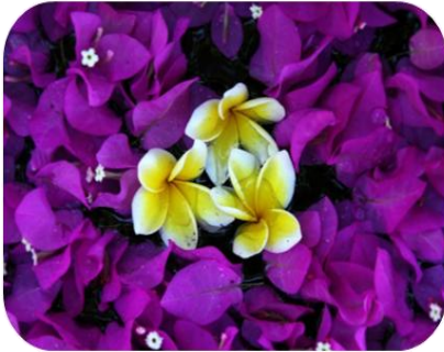
Căsătoria și regulile sale

Această parte cuprinde următoarele capitole: