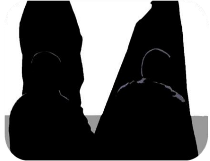
Reguli speciale pentru femeile musulmane