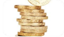
Capitolul 3: Zakāt