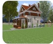
LEASING, ÎNCHIRIERE ȘI ANGAJARE