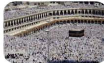
Capitolul 5: Pelerinajul