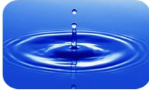
Capitolul 1: Puritatea

Această parte cuprinde următoarele capitole: