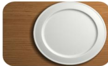
Capitolul 4: Postul