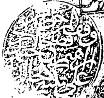
صفحة العنوان من نسخة تكية الخالدية (ع)

مكتبة الادب المكتبة الادبية المكتبة الادبية المكتبة الادبية