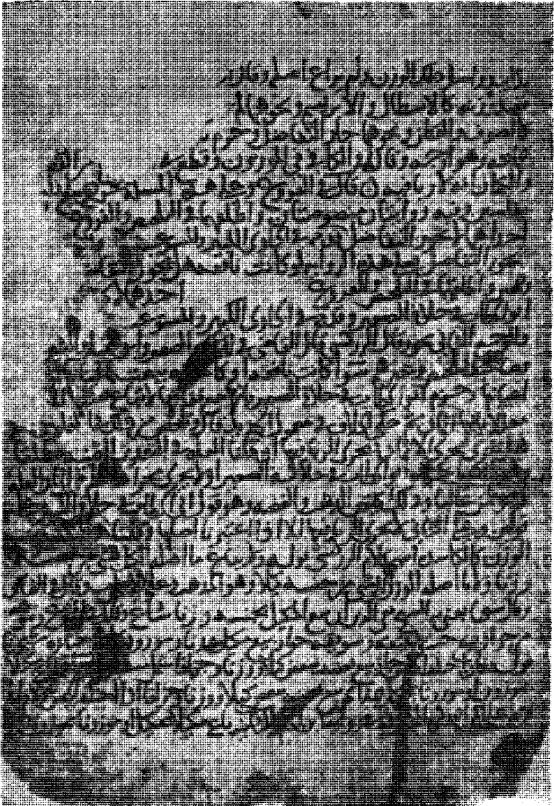
أول صفحة من الموجود من الجزء الثالث بخط المؤلف وهي الصفحة الثالثة من أول الجزء