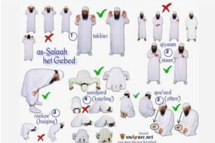
De verschillende posities tijdens as-galaah (het gebed).

13.) Tasliem (het beëindigen van het gebed)