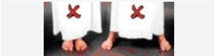
Onjuiste posities van de voeten tijdens het staan.

[Stand van de voeten: de voeten dienen ongeveer onder de schouders geplaatst te worden, niet te dicht bij elkaar en niet te ver uit elkaar. De tenen dienen richting de qiblah te wijzen.]