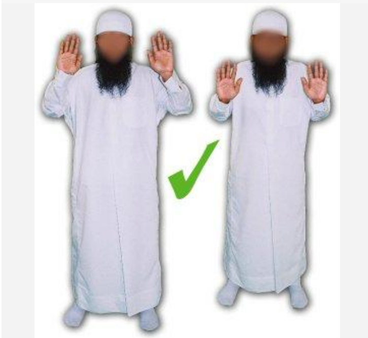
De juiste manier om de takbier te verrichten.

35) Men dient ze op te heffen op gelijke hoogte met de schouders, het is ook toegestaan om ze op te heffen tot gelijke hoogte met de oorlellen. Ik zeg: met betrekking tot het aanraken van de oorlellen met de duimen is er geen basis in de Soennah , het heeft volgens mijn opvatting eerder te maken met waswaas (inluisteringen van de shaytaan ).