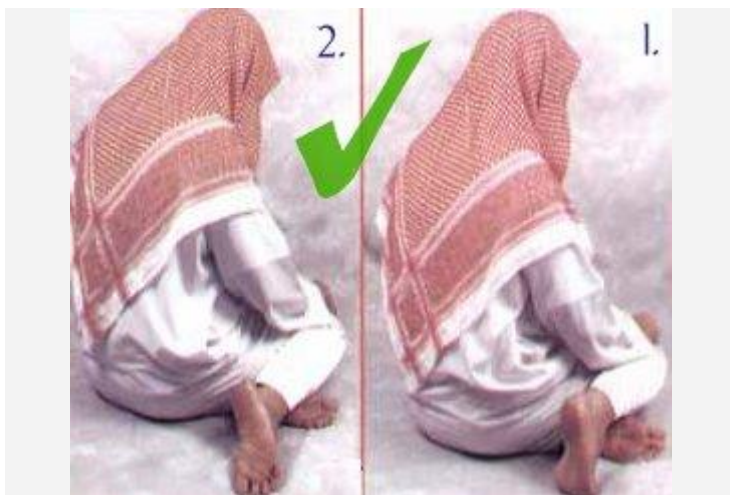
De correcte zithouding (moetawarikan) tijdens de tweedetashah-hoed.