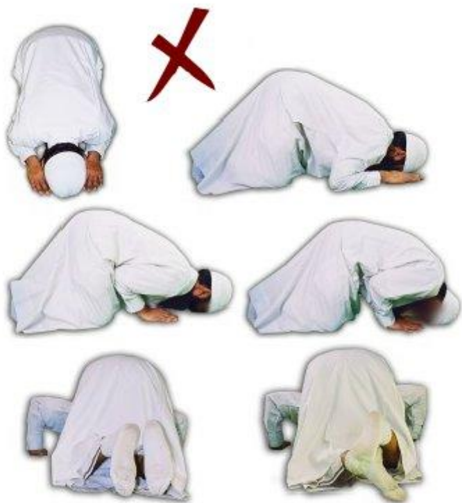
Incorrecte houdingen tijdens de soedjoed

95) Men dient de neus en het voorhoofd stevig op de grond te plaatsen. Dit is een essentieel deel van het gebed.