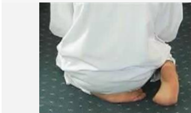
De ifraash zithouding.

De correcte manier om te zitten tussen twee sadjdahs: links is de iq'aa-e houding en rechts de ifraash houding.