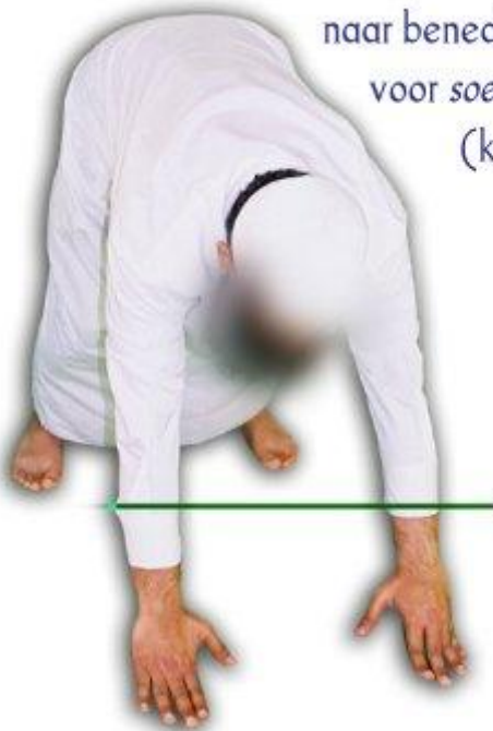
De correcte manier om naar soedjoed te gaan.

naar beneden gaan voor soedjoed (knieling)