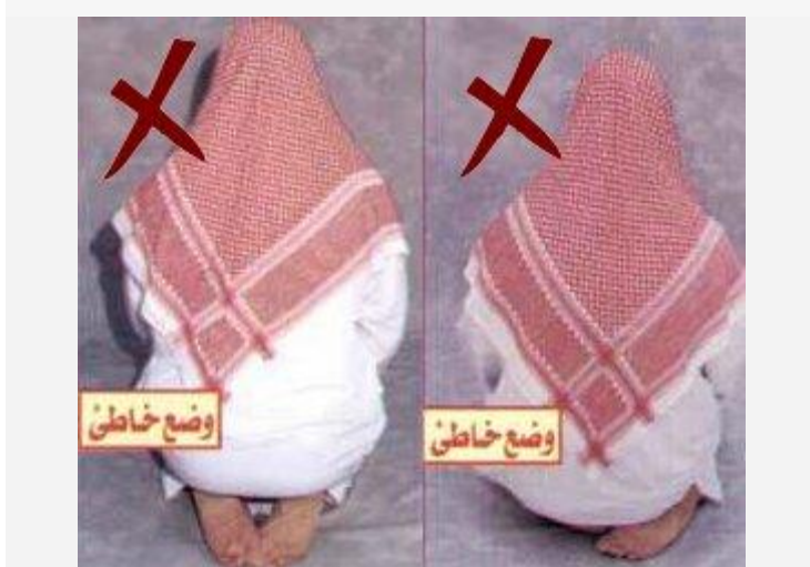
Onjuiste zithoudingen tijdens de tweede tashah-hoed.

171) Men dient de rechervoet rechtop te zetten (zie 1.).