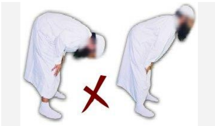
De roekoe' op deze manieren is niet correct!

76) Men dient de ellebogen weg van de zij te houden.