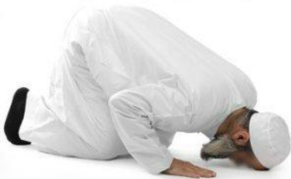
De soedjoed of sadjdah.