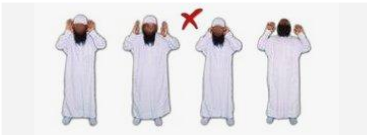
Zo wordt de takbir incorrect verricht!

[Stand van de voeten: de voeten dienen ongeveer onder de schouders geplaatst te worden, niet te dicht bij elkaar en niet te ver uit elkaar. De tenen dienen richting de qiblah te wijzen.]