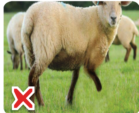
العرجاء: Ҳайвоне, ки як пояш ланг буда, роҳ рафта наметавонад.