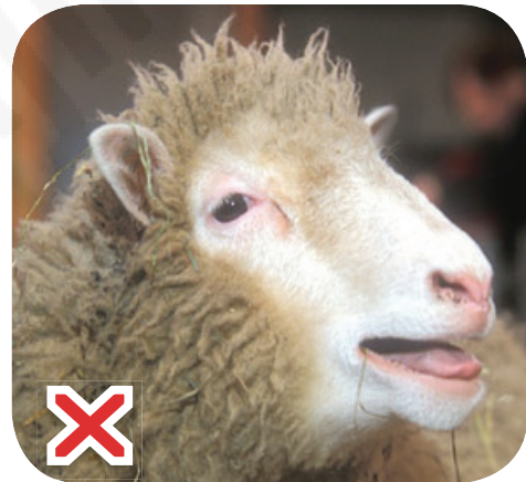
الجماء: Оне, ки ҳанӯз шох набароварда.