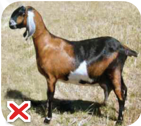
البنراء: Оне, ки дум надошта бошад.