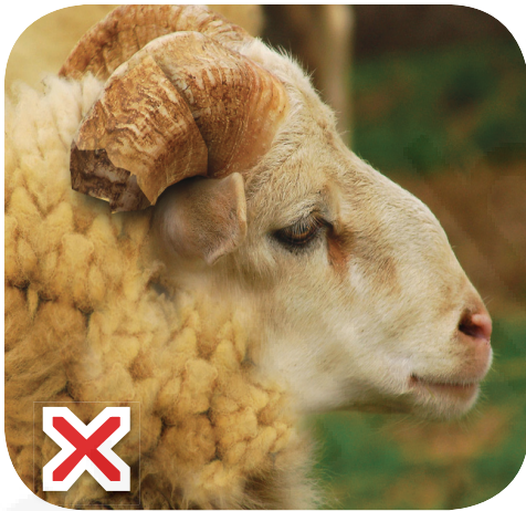
Дар шохаш шикастагӣ бошад