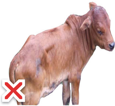
العجفاء: Ҳайвоне, ки лоғар буда, ки устухонаш мағз надошта башад.