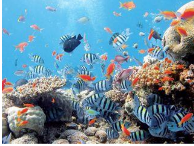
ক্যাপ: সাগরবক্ষে নি‘আমতের ভাণ্ডারের নমুনা

আল্লাহ তা‘আলা এ মহাবিশ্বের মহাস্রষ্টা। তিনি বিশ্বচরাচরের সব সৃষ্টি করেছেন মানুষের প্রয়োজন পূরণের নিমিত্তে। জাগতিক জীবনকে সুন্দর ও সার্থক করার জন্য। মানুষ তাঁর সব নি‘আমত ভোগ করবে আর একমাত্র তাঁরই ইবাদত করবে। পার্থিব নি‘আমত কাজে লাগিয়ে পরকালের অনন্ত জীবনের সুখ সন্ধান করবে। এসব সৃষ্টির মধ্যে অন্যতম শীর্ষটি হলো সাগর। সাগর আল্লাহর এমন এক বৃহৎ সৃষ্টি যা মানুষের জন্য অফুরন্ত কল্যাণের ভাণ্ডার। মহান স্রষ্টার সৃষ্টির অন্যতম বিস্ময় এ সাগর। সভ্যতার সূচনালগ্ন থেকেই মানুষের নিরন্তর কৌতূহল জাগিয়ে রেখেছে সাগর। চলছে সাগর নিয়ে মানুষের বিরামহীন গবেষণা ও অনুসন্ধান।