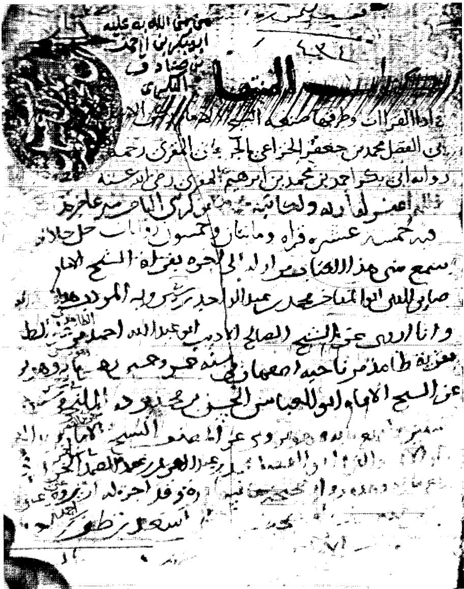
صورة الغلاف من الأصل