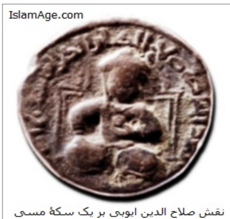
نقش صلاح الدین ایوبی بر یک سکه مسی

با رسیدن سپاهیان فرانسه و انگلستان آن ها توانستند سواحل و بنادر لبنان و فلسطین را از صلاح الدین بازپس گیرند اما در حمله به مصر و مناطق داخلی ناکام ماندند و نتوانستند به بیت المقدس حمله ببرند. در پایان ریچارد معاهده رمله را با صلاح الدین امضا نمود. بر اساس این معاهده زیارت بیت المقدس برای نصارا آزاد گردید و تاجران مسلمان نیز می توانستند در شهرهای تحت کنترل صلیبی ها به تجارت پردازند.