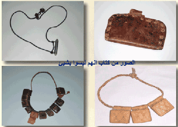
الصور من كتاب انهم ليسوا بشي

സ്നേഹവും നന്മയും വരുത്തുവാനും അവർക്ക് ഉണ്ടായേക്കാവുന്ന തിന്മ തടയുവാനും സാധിക്കുമെന്ന് കരുതുന്നു. ചിലർ സന്താന സൗ