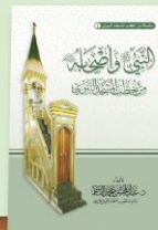
Annabi tsira da amincin Allah su tabbata a gare shi da sahabbansa