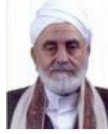
إبراهيم بن محمد الوزير

وبالرغم من الانتشار المحدود لهذه الصحف، وقلة قرائها؛ إلا أنها تلعب دورًا في الترويج لعقائد الشيعة، ومهاجمة هيئات علماء أهل السنة؛ على اختلاف تياراتهم؛ كالشيخ عبد المجيد الزنداني، والشيخ عبد الوهاب الديلمي، والشيخ حسين بن شعيب، والوقوف في صف العلمانيين، والرّد على ما يكتب في صحف ومجلات التيارات السنية؛ كالسلفية، وجماعة الإخوان المسلمين.