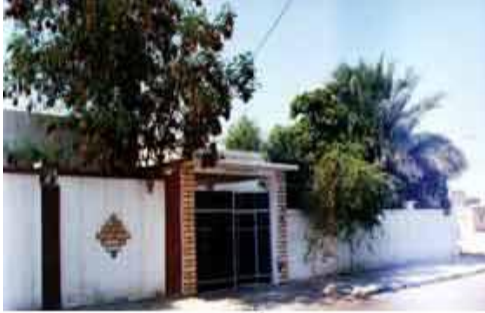
حسينية الرسول الأعظم - قسم النساء