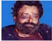
جثة حسين الحوثي

يعتبر التمرد الذي قاده الحوثيون بدءاً من يونيو/ حزيران سنة ٢٠٠٤م أحد مظاهر الاختراق الإثني عشري للزيدية في اليمن. ففي ذلك العام: قاد حسين بدر الدين الحوثي تمرداً ضد السلطات، في منطقة صعدة بشمال اليمن، واستمر لمدة (٣) أشهر، قتل فيه أكثر من (٤٠٠) شخص، وقتل فيه حسين الحوثي.