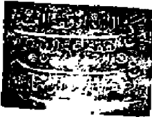
عنوان نسخة حلب «ح»