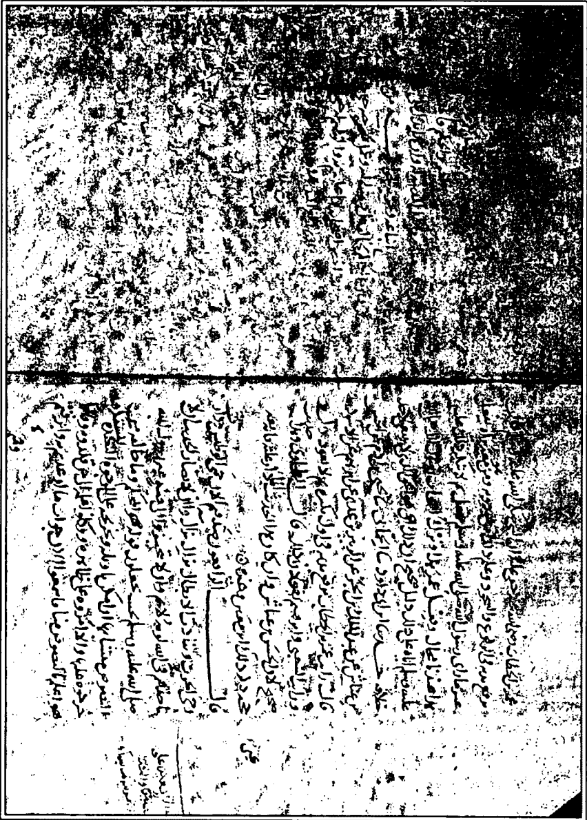
الورقة (٥٣) من (المحمودية - الأصل) وتبدو آثار الطمس واضحة