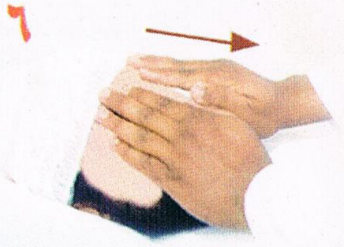
يمسح المرافق وجه المريض