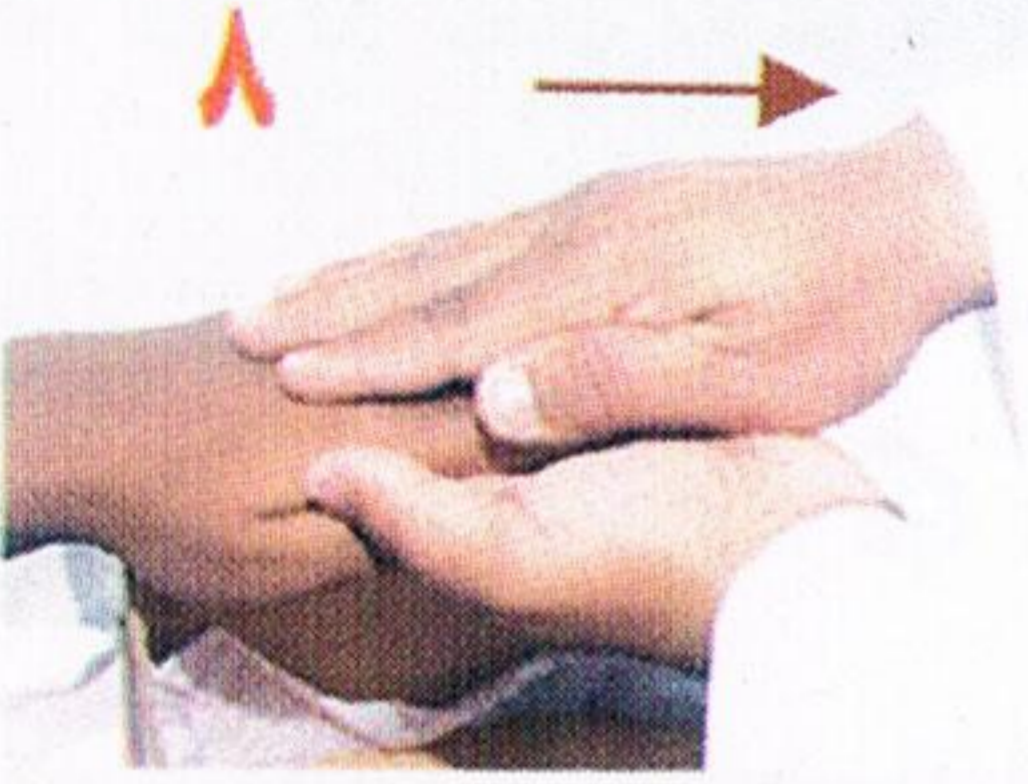
يمسح المرافق بيده اليمنى يد المريض اليسرى

* إذا تيمم المريض للصلاة ثم بقي على طهارته إلى وقت الصلاة الأخرى فإنه يصلّيها بالتيمم الأول ولا يعيد التيمم.