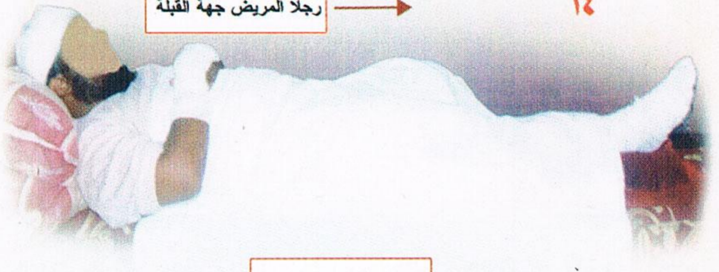
صلاة المريض مستقياً