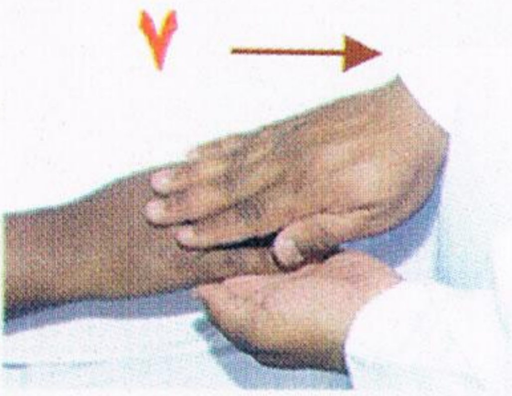
يمسح المرافق بيده اليمنى يد المريض اليمنى