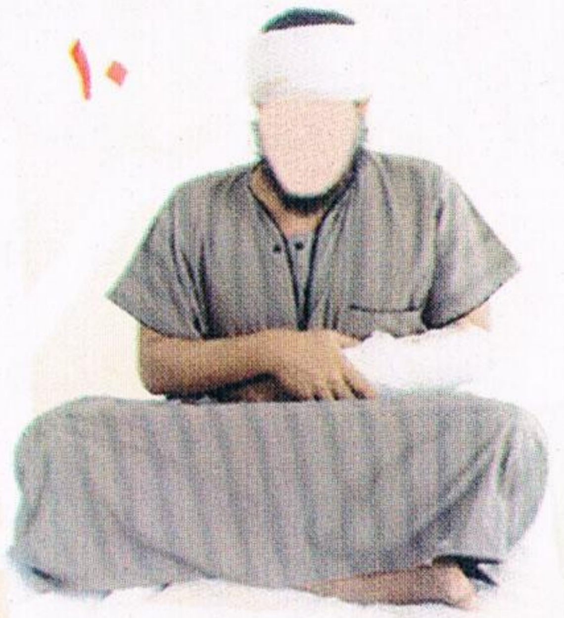
صلاة المريض متربعا في جلوسه

السجود فتكون يديه على الأرض إذا استطاع ذلك ، ( انظر صورة رقم ١٢ ) فإن لم يستطع جعلها على ركبتيه .