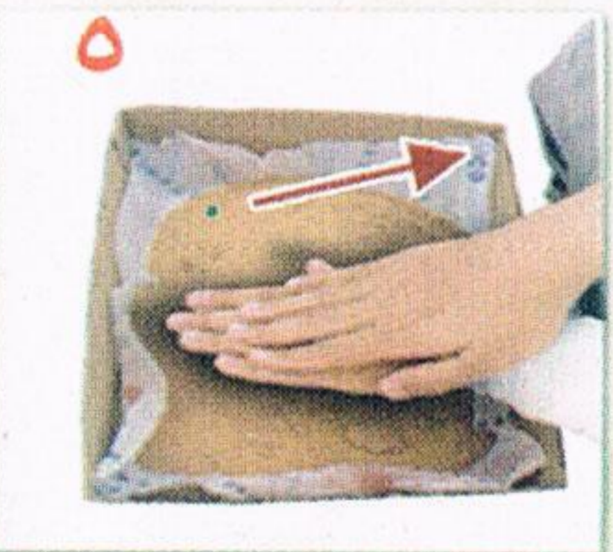
يمسح المريض بيده اليمنى على يده اليسرى