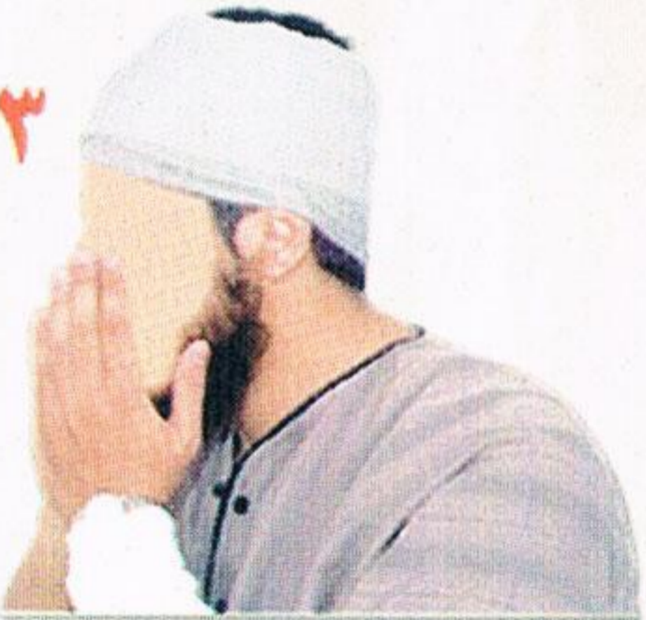
يمسح المريض وجهه من أعلى إلى أسفل على الترتيب