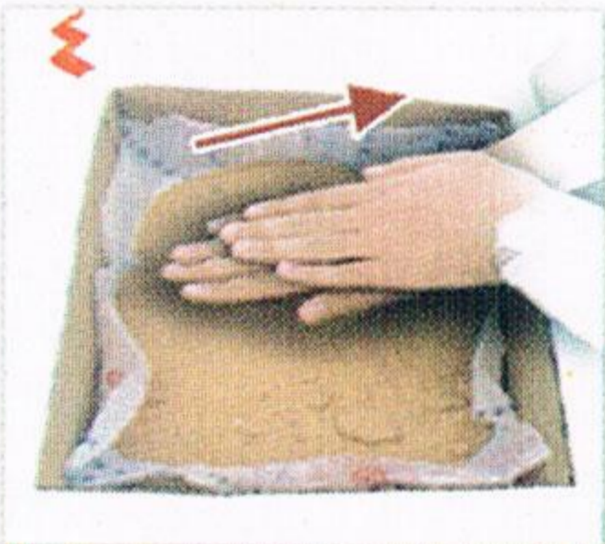
يمسح المريض بيده اليسرى على يده اليمنى