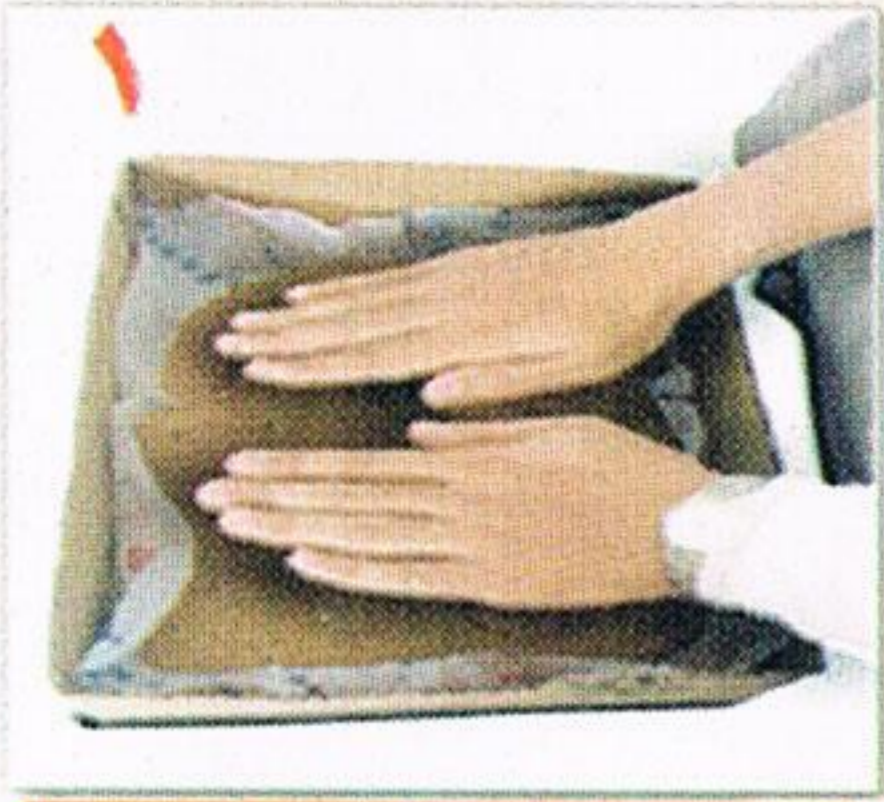
يضرب المريض التراب ضربة واحدة

* فيضرب هذا الشخص الأرض الطاهرة مرة واحدة بيده كما سبق ( انظر صورة رقم ١ ) ، ثم يمسح بهما وجه المريض وكفيه ( انظر صورة رقم ٦ ، ٧ ، ٨ ) .